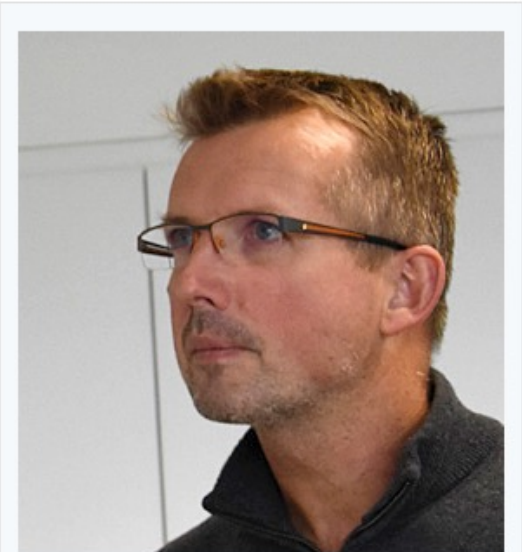
Full Professor at University of Bordeaux